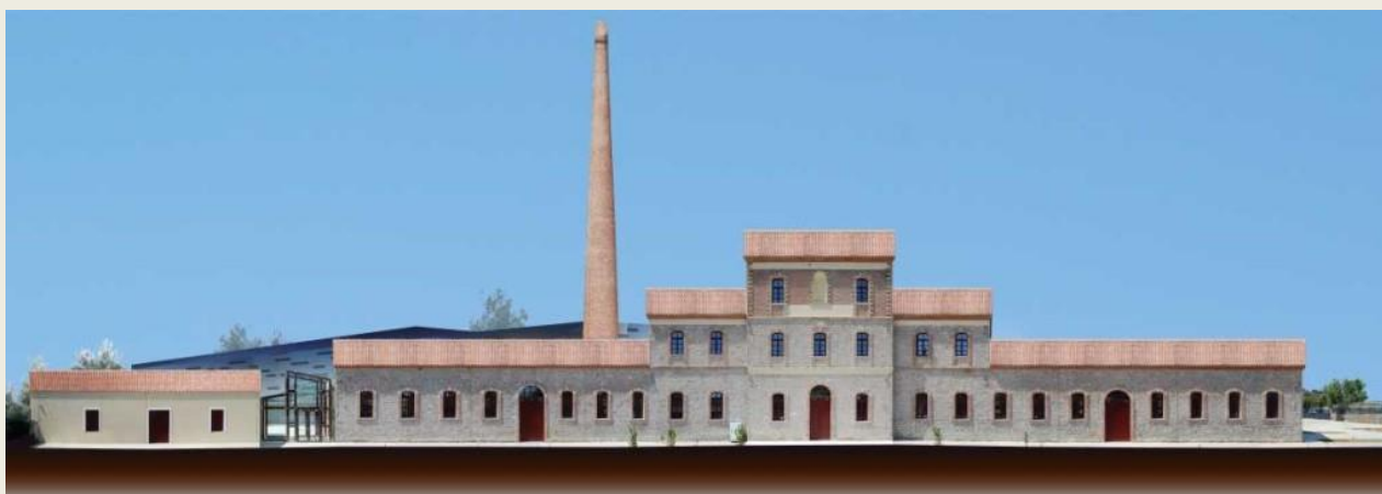
Διαχρονικό Μουσείο Ευβοίας «Αρέθουσα»