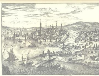
NEGROPONTE | NEGROPONTE

Την Τετάρτη 24 Οκτωβρίου 2018 στο πλαίσιο του 12ου Συνεδρίου Μεσαιωνικής και Νεότερης Κεραμικής της Μεσογείου θα παρουσιαστεί με τη μορφή επίδειξης οστράκων (hands on pottery) η παραγωγή κεραμικών εφυαλωμένων και μη από την περιοχή της Χαλκίδας. Η εκδήλωση θα πραγματοποιηθεί στο Διαχρονικό Μουσείο «Αρέθουσα» στη Χαλκίδα, ενώ τη γενική εποπτεία έχει ο Πλάτων Πετρίδης, Πρόεδρος της Οργανωτικής Επιτροπής του Συνεδρίου και Αναπληρωτής Καθηγητής Βυζαντινής Αρχαιολογίας στο ΕΚΠΑ. Τα ευρήματα από την πόλη της Χαλκίδας παρουσιάζουν